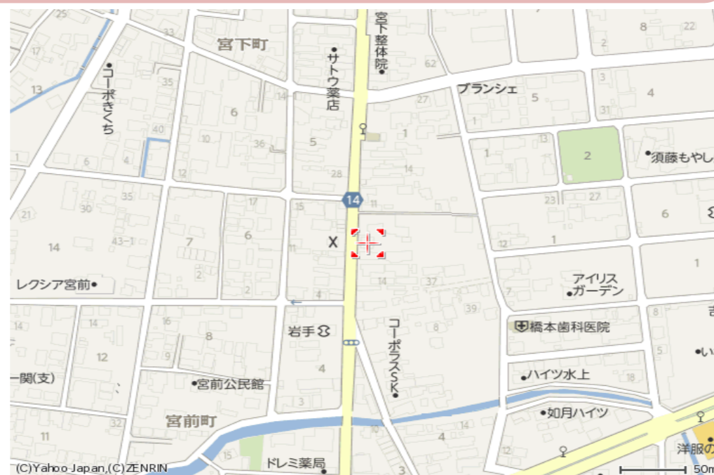
宮前町分譲地 2区画